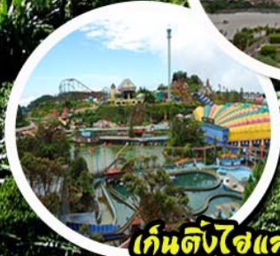
เก็นติ้งไฮแลนด์