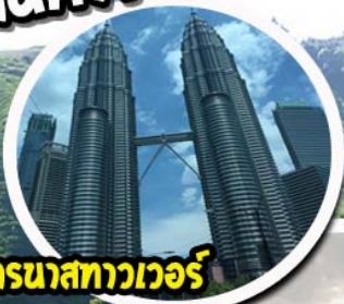
เปโตรนาสทาวเวอร์ กัวลาลัมเปอร์