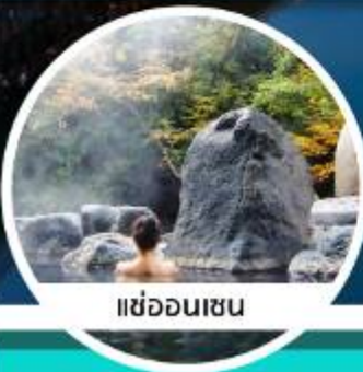
แช่ออนเซน

10-14 / 13-17 พ.ย.62 16-20 / 19-23 พ.ย.62 22-26 / 28 พ.ย.-2 พ.ค.62