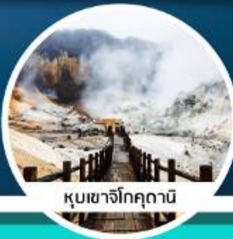
หุบเขาจิโถคุดามิ