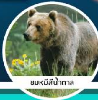
ชมหมีสีน้ำตาล