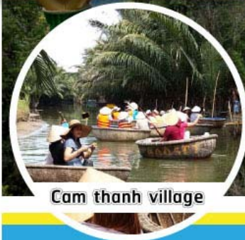
Cam thanh village