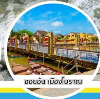
ฮอยอัน เมืองโบราณ