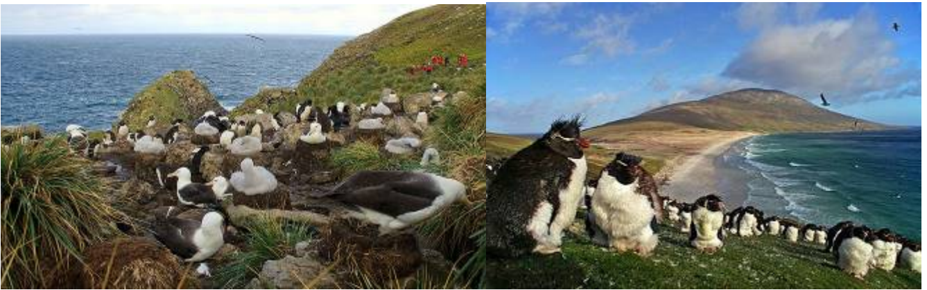
(อาหารเช้า, กลางวัน, เย็น, อาหารว่าง มีบริการบนเรือ ระหว่างการเดินทาง)

นำท่านสู่เกาะแซนด์เคอร์ (Saunders Island) อันเป็นที่อยู่ของฝูง นกเพนกวินพันธุ์เกนตู (Gentoo Penguins) และ นกเพนกวินจักรพรรดิ (King Penguins) ซึ่งมีกว่าพันตัวในบริเวณนี้ อีสระให้ท่านได้สัมผัสและถ่ายรูปกับฝูงนกเพนกวินนานาพันธุ์แบบใกล้ชิด